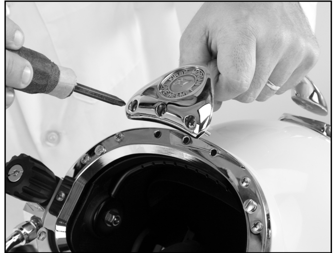
Apoye la agarradera en el casco.

2. Apoye la agarradera y ajuste un poco los tornillos delanteros hasta que estén firmes